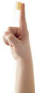
MANTEQUILLA 1 Ración