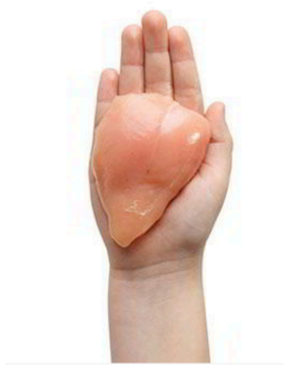
FILETE DE POLLO 1000 GR