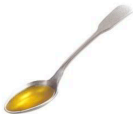
CUCHARILLA 5 ml.