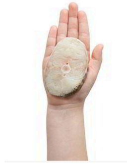
FILETE DE PESCADO 100 GR