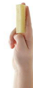
QUESO 1 REBANADA