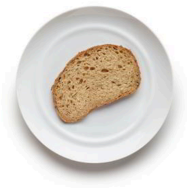
REBANADA DE PAN 25 GR.