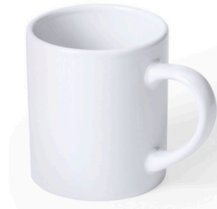
TAZA 200 ml / 200 GR