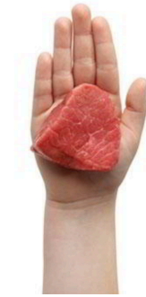
FILETE DE TERNERA 100 GR